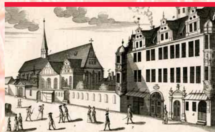
Stich von Johann Stridbeck, 1690, Paulinerkirche und Fürstenhaus. Engraving by Johann Stridbeck, 1690, Pauliner Church and Fürstenhaus.