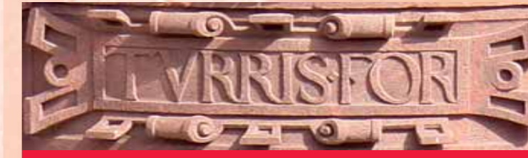
Bildhauerische Details am Fürstenerker

Über den sechs Fenstern, in typischem Renaissance-Rollwerk gerahmt, ist die lateinische Inschrift „Turris fortissima nomen domini beati omnes qui confluit in eo“ zu lesen, was soviel bedeutet wie: „Der festeste Turm ist der Name des Herrn, glücklich alle, die sich zu ihm bekennen.“ Am Erker finden sich weitere zeittypische bildhauerische Details, so etwa Flechtbänder und hängende Girlanden, die die Fenster voneinander trennen, aber auch Diamantquader und Eierstabfries. Unten am Konsolstein ist das Steinmetzzeichen Wiedemanns zu sehen.