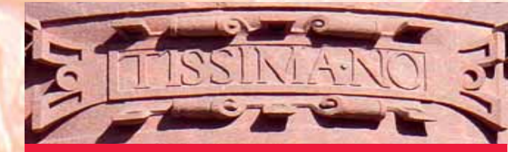
Sculptural details on the corner turret

Above the six windows, framed in typical Renaissance scrollwork, one can read the Latin inscription: „Turris fortissimo nomen domini beati omnes qui confluit in eo“, meaning: „The name of my Lord is the safest stronghold; happy are those who believe in Him“. Further sculptural details which were typical of that time can also be found in the form of braids and hanging garlands in between the windows or as diamond ashlars. Underneath on the corbel, one can see Wiedemann's signature as a stonemason.