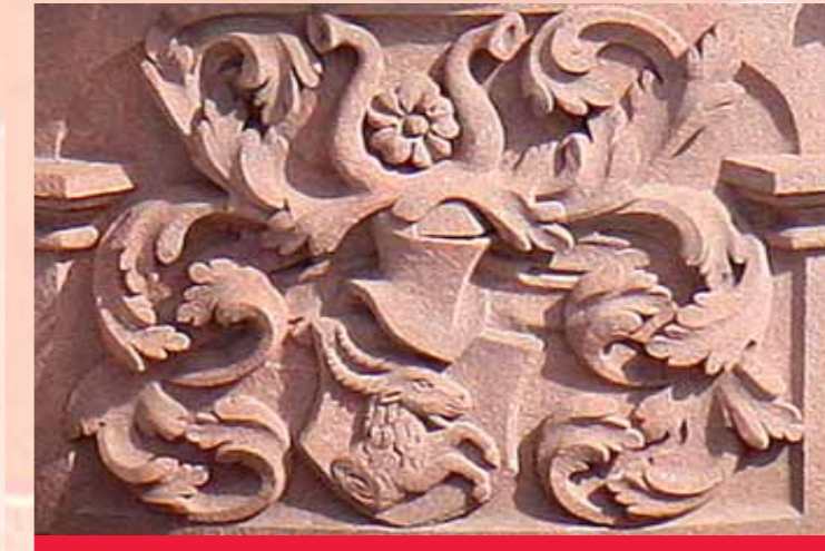
Fürstenhaus, 1890.