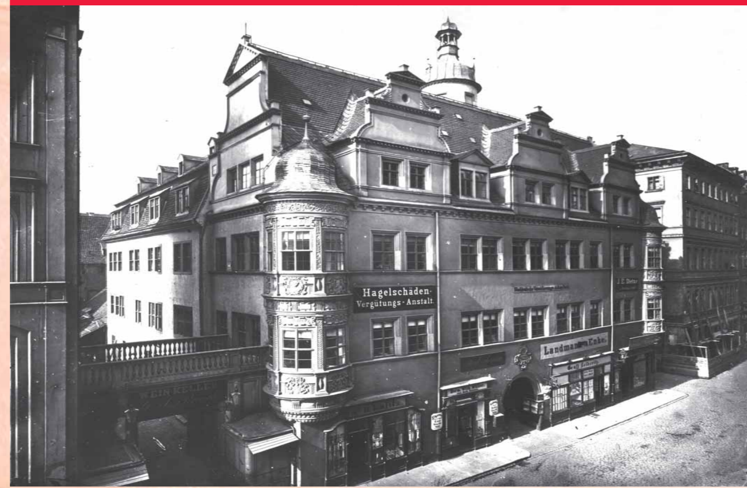
Fürstenhaus